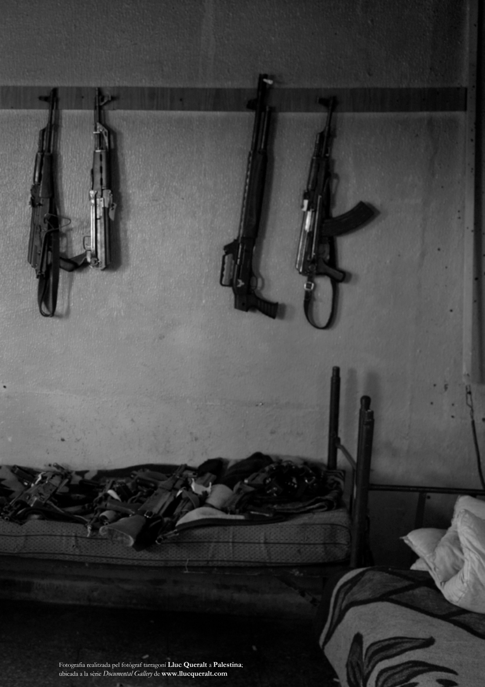
Fotografia realitzada pel fotògraf tarragoní Lluc Queralt a Palestina; ubicada a la sèrie Documental Gallery de www.llucqueralt.com