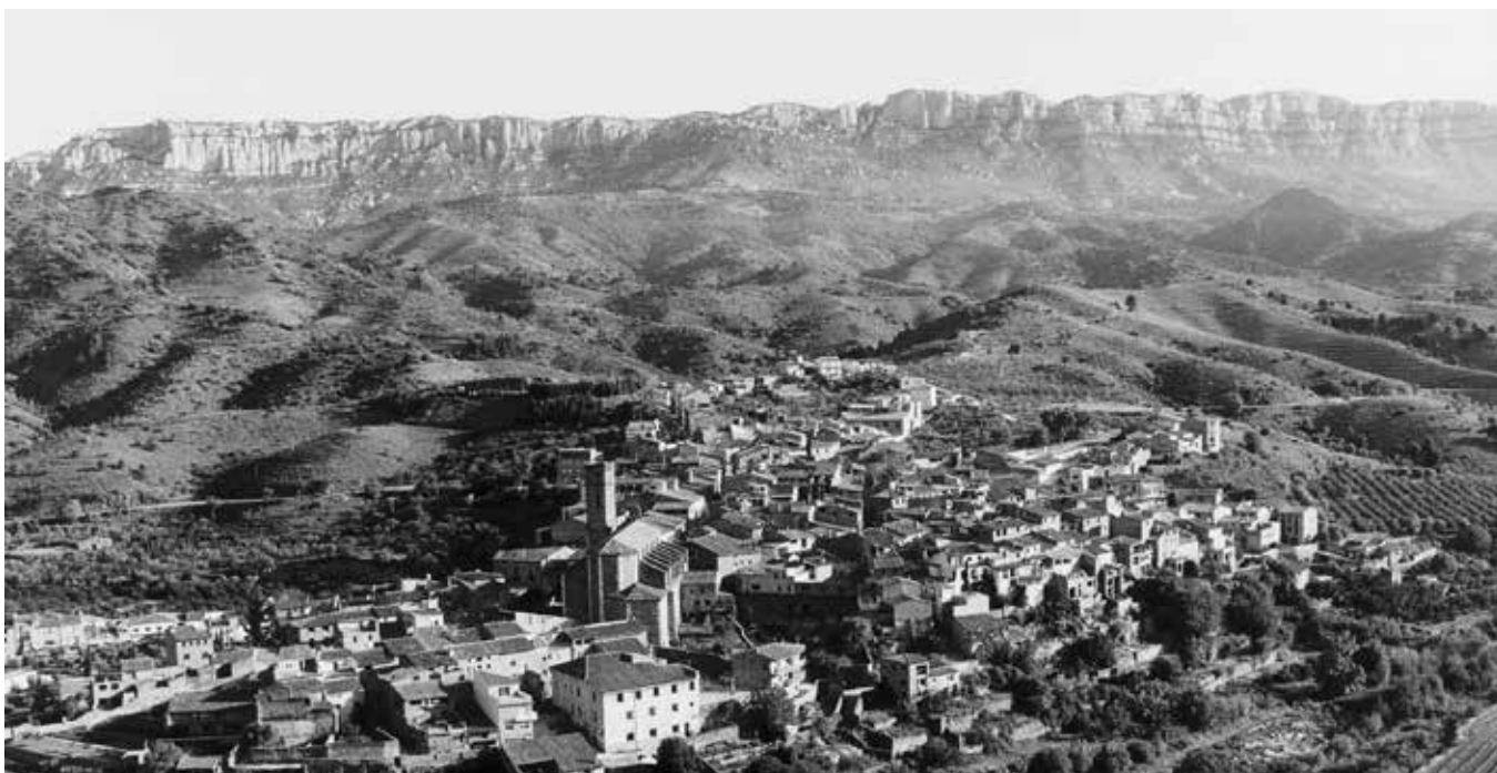
A l'esquerra.